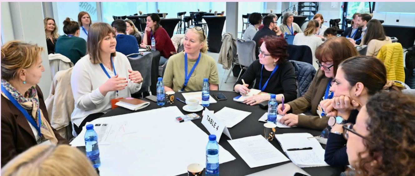
Workshop med Islandske Redd Barna (Barnaheill) og Bulgarske organisasjoner

Bulgarske kvinneorganisasjoner står i betydelig motgang. Flesteparten av kvinneorganisasjonene Tuva møtte jobber primært med vold mot kvinner. De står i førstelinja for å hjelpe kvinner ut av voldelige forhold, med juridisk og praktisk hjelp.