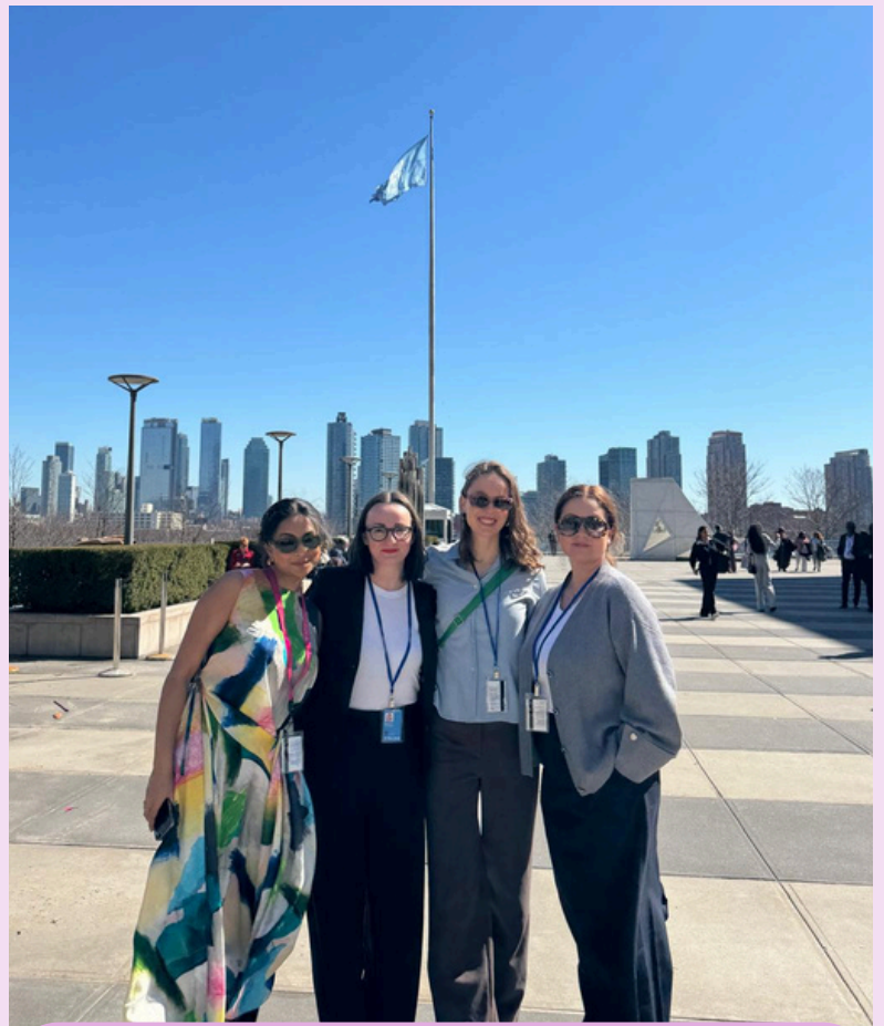
JURK, ROSA og Norges Kvinnelobby

Vi skal invitere til et medlemsmøte om erfaringene fra CSW70 og vårt internasjonale arbeid! Mer info kommer.